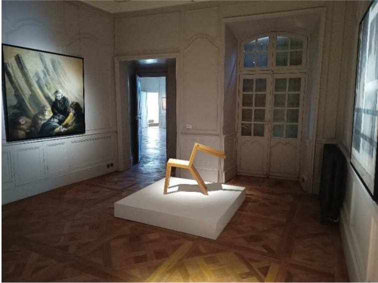
Vue des 3 salles d'exposition en 2023